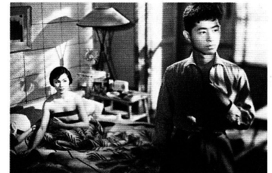
1956年日活。監督・古川卓巳、出演・長門裕之、南田洋子、石原裕次郎ほか