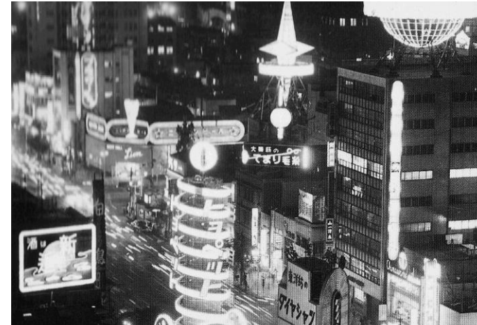
ネオンまたたく東京銀座。 戦後10年で完全復活